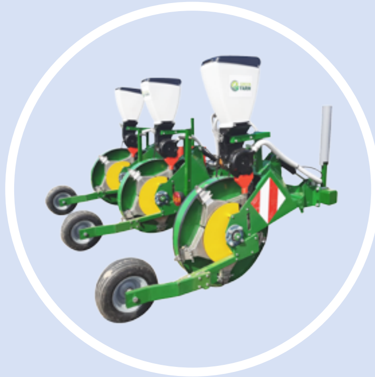
SEMINATRICE IMEON Imeon Planter